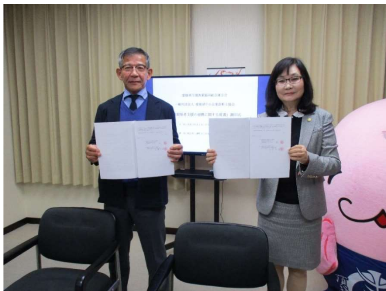
覚書締結時の様子

令和3年1月18日漁業者経営相談センター(事務局:業務統括本部融資課)を立ち上げ、現場における漁業者の課題解決に向けて、関係機関と連携し実践しております。