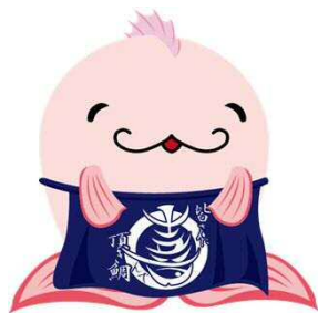
JFマリンバンクえひめ イメージ キャラクター 浜鯛長